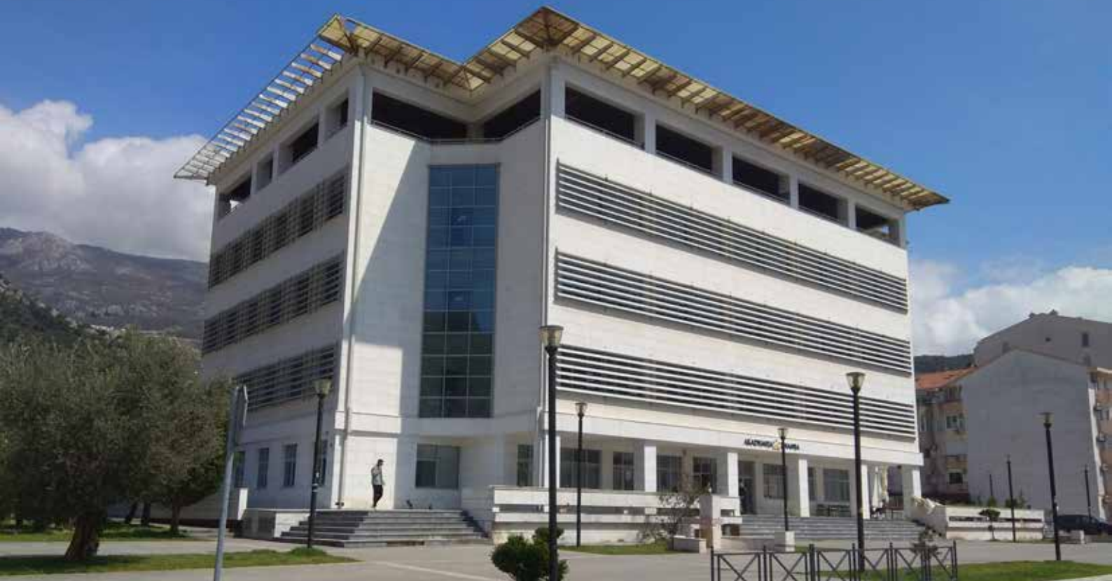
Konferencijski centar „Akademija znanja“ Budva (KC)